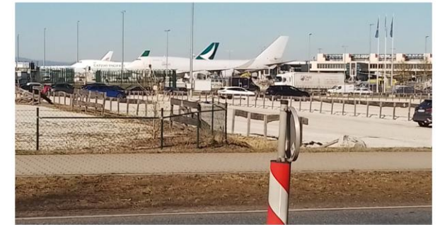
Terminal 3 im Süden