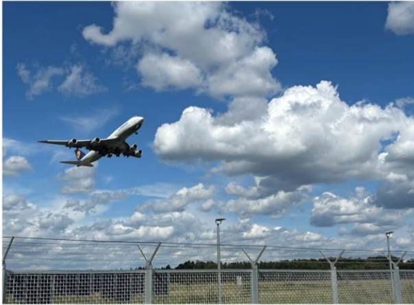
Startbahn 18 West

Tourlänge: rund 22 km (kein E-Bike erforderlich)