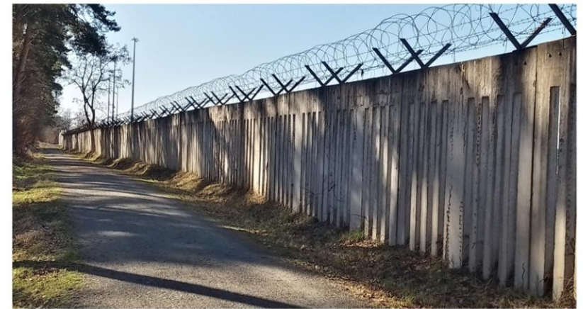
Betonmauer von 1981

In den 80er Jahren des vergangenen Jahrhunderts war Mörfelden-Walldorf Gegenstand bundesweiter Berichterstattung, ja sogar in der Weltpresse gab es Artikel: Die Bewegung gegen den Bau der Startbahn West.